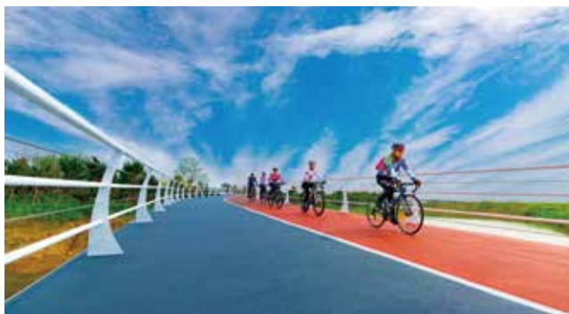
山海天阳光海岸绿道骑行