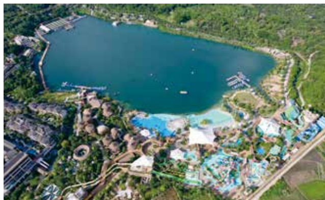
森林海废弃矿坑湖修复点