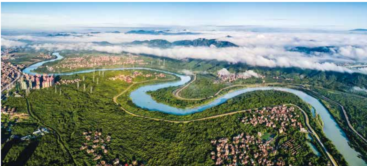
流溪河入选全国第二批美丽河湖优秀案例