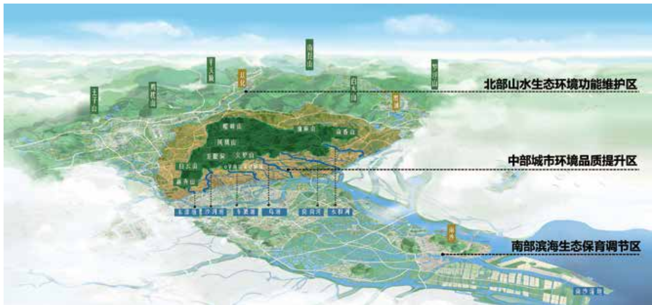
广州“新青山新六脉”山水格局图