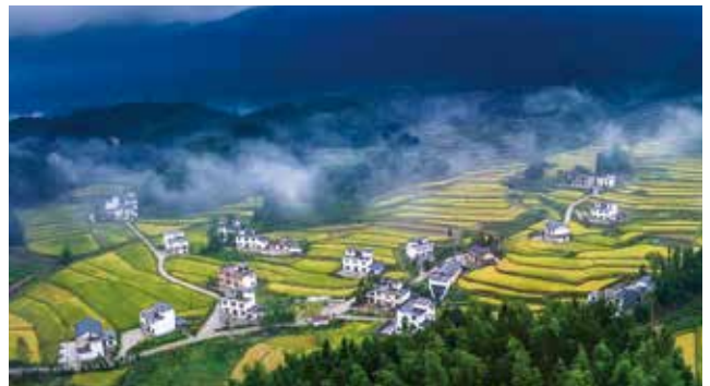
铜鼓县温泉镇新开岭村