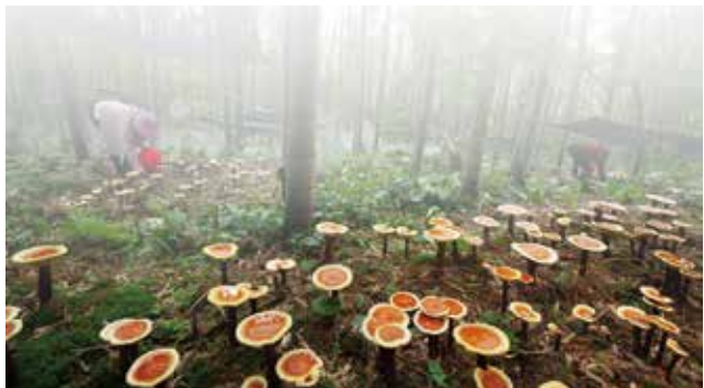
铜鼓县花山林场上四坊林下经济基地