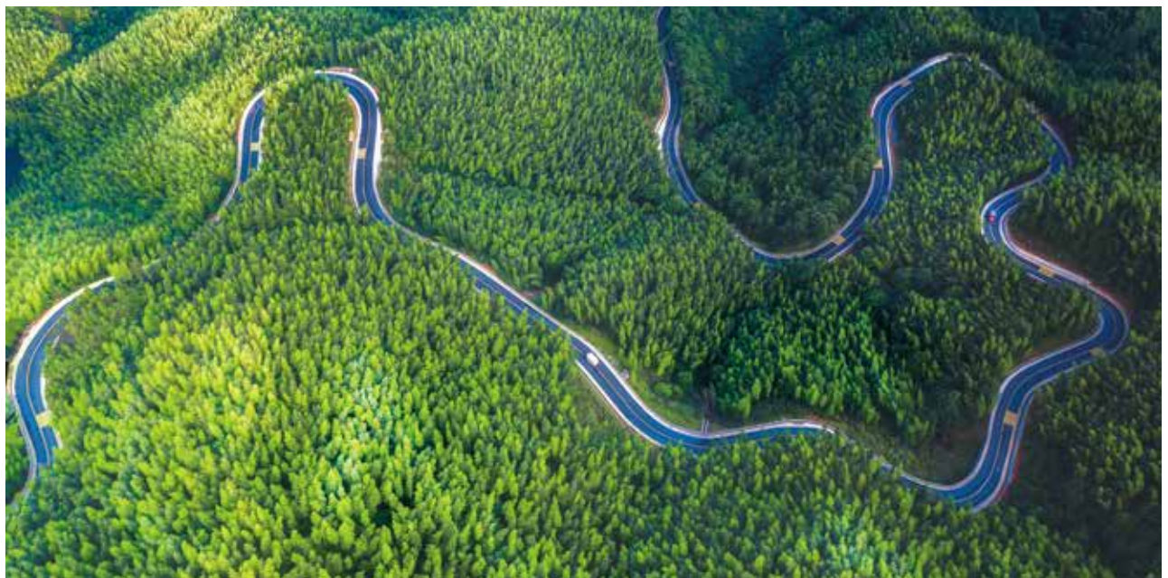
铜鼓县带溪乡新丰村