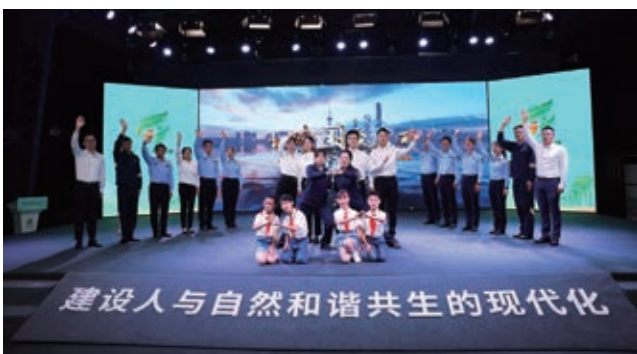
六五环境日主题宣传活动

头、环保宣教中心和相关地市生态环境部门为主体、媒体参与支持的区域生态环境保护宣传教育联动体系。联合举办“奋进新征程 建功新时代——见证美丽长三角”主题采访、环保摄影展、“长三角生态环境名嘴诵读”、志愿“净滩”等活动，推动区域生态环境宣传教育协同发展。