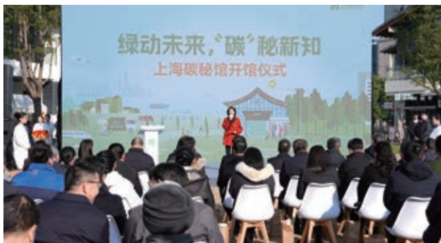
建成首家低碳科普场馆——上海碳秘馆