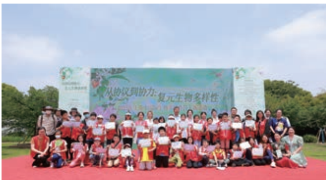
国际生物多样性日主题宣传活动