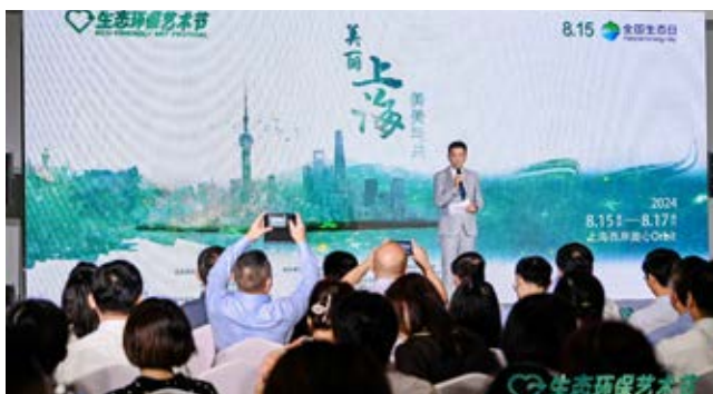
上海生态环保艺术节