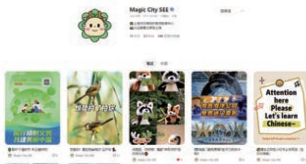
“Magic City SEE”小红书账号